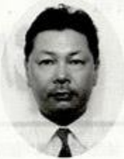
同窓会会長（一期生）