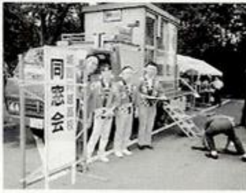
当日、同窓会として、けやき祭に参加したOBたち

好評を博しました故、しばしこの企画を続けてみようか、と思っております。卒業生の皆様、学校を訪れる機会は、年々ともなう少なくなることでしょうがよろしければ、お子様のいらっしゃる方が、ご見学にいられることを心待ちにしております。けやき祭は、毎年九月の第一土・日曜日です。