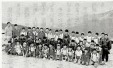
<第1学年林間学校・北志賀高原電王山頂>

臨海公園へと、生徒の立てたスケジュールを基に行動した。あいにくの雨ではあったが、充実した一日であった。