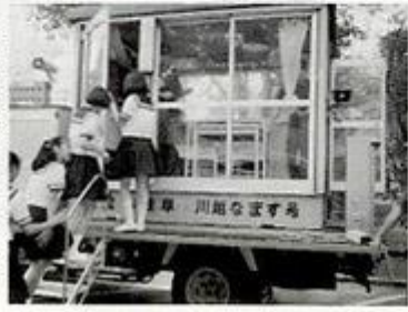
貴重な体験ができたという好評だった川越なます号