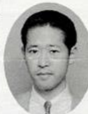
同窓会幹事長（二期生）

同窓会活動の縮小も考えましたが、まずは同封しました活動補助金の募集にありますように、同窓生の皆さんに、ご理解とご協力をお願いしまして、将来の同窓会へ夢をつないでいきたいと考えます。平成七年の春には、同窓会設立二十周年事業の計画があります。ご支援をお願いします。